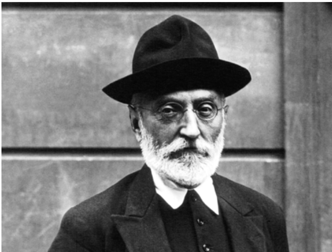
Miguel de Unamuno

He aquí un listado de famosos con sus tiempos de vida.