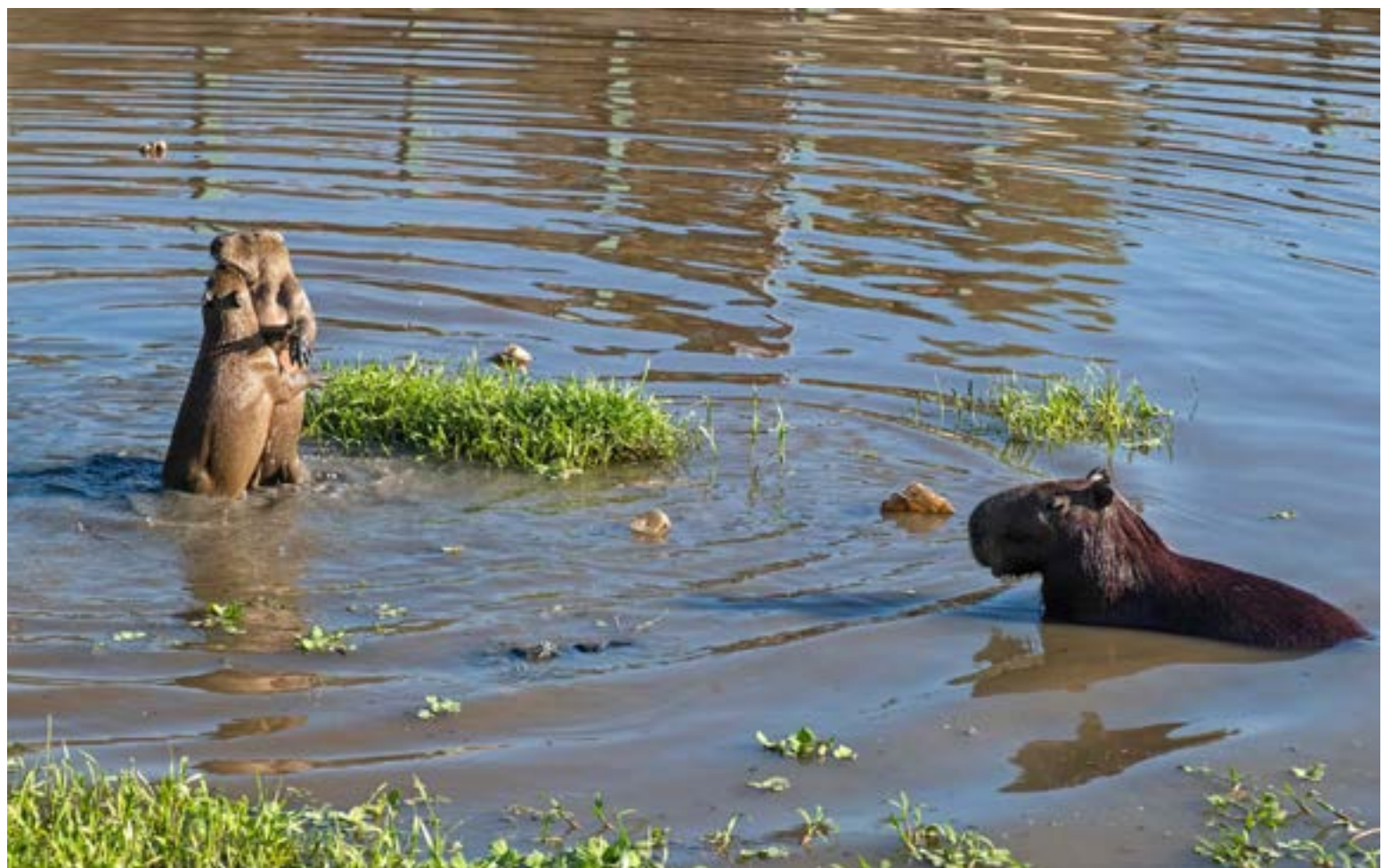
«La prioridad del Gobierno es el cuidado de la vida y en este caso garantizar la conservación y el trato digno de esta especie emblemática de nuestra fauna silvestre»

Esta postura del Ministerio se fundamenta en más de dos décadas de investigaciones científicas y consultorías especializadas sobre la dinámica poblacional del chi-