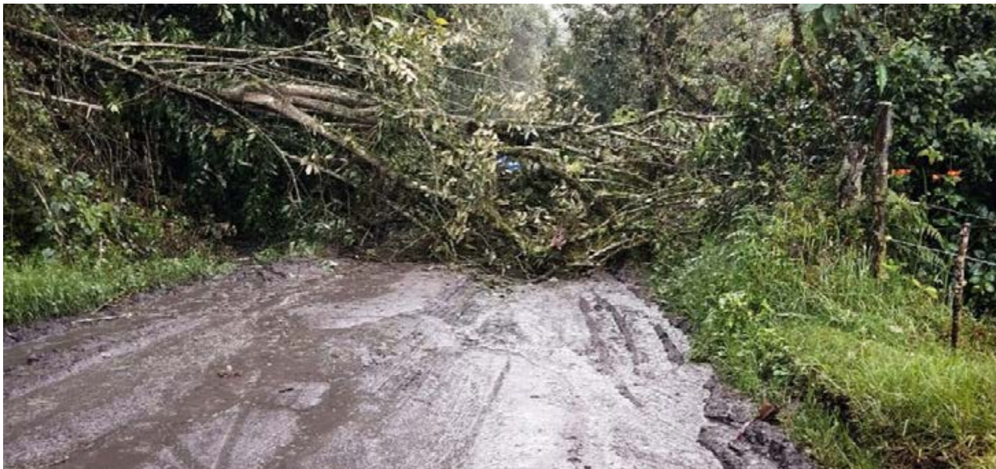
Un masivo derrumbe en el sector Algodonal de Quetame ha dejado al municipio completamente incomunicado.