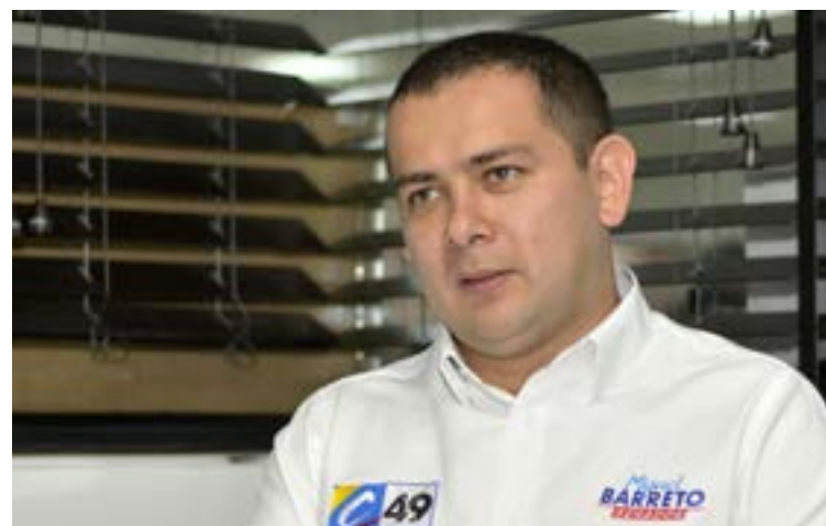
Miguel Ángel Barreto, es investigado por la Corte Suprema de Justicia, por los presuntos delitos de concierto para delinquir y cohecho propio.

La red extendía sus tentáculos a múltiples entidades públicas, operando tanto a nivel nacional como en territorios específicos. El Departamento para la Prosperidad Social (DPS) ha sido una de las entidades mencionadas, junto con administraciones municipales, especialmente en departamentos del Eje Cafetero y el suroccidente del país.