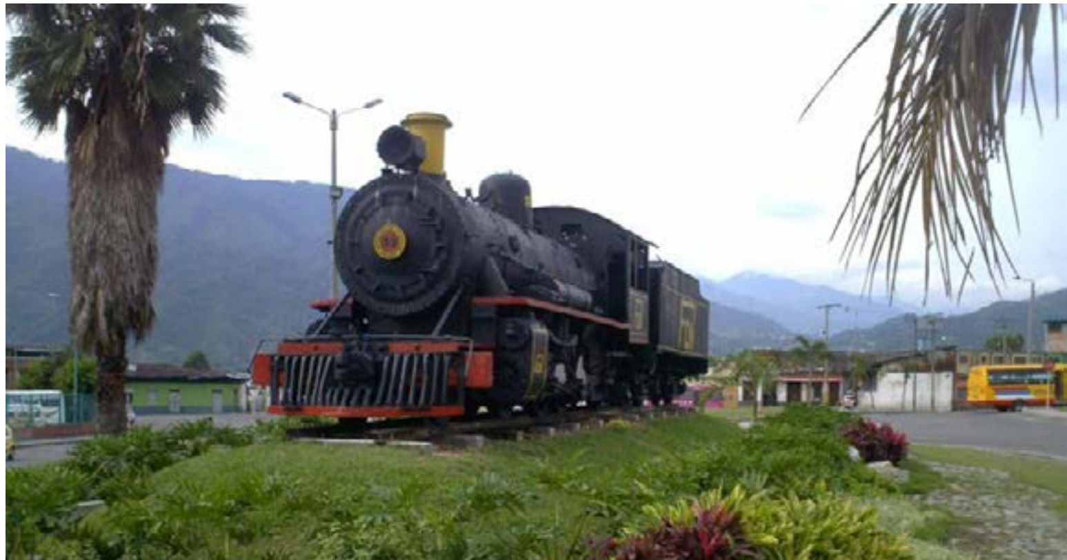
Recuerdo del tren del Tolima

Las demoras causadas a las obras por la guerra de los Mil Días y por las reiteradas dificultades burocráticas, mantuvieron detenidos los trabajos en Girardot por 10 años. Sólo dentro del impulso que dio a las obras públicas el gobierno de Rafael Reyes, se eliminaron obstáculos y pudo adelantarse la carrilera has-