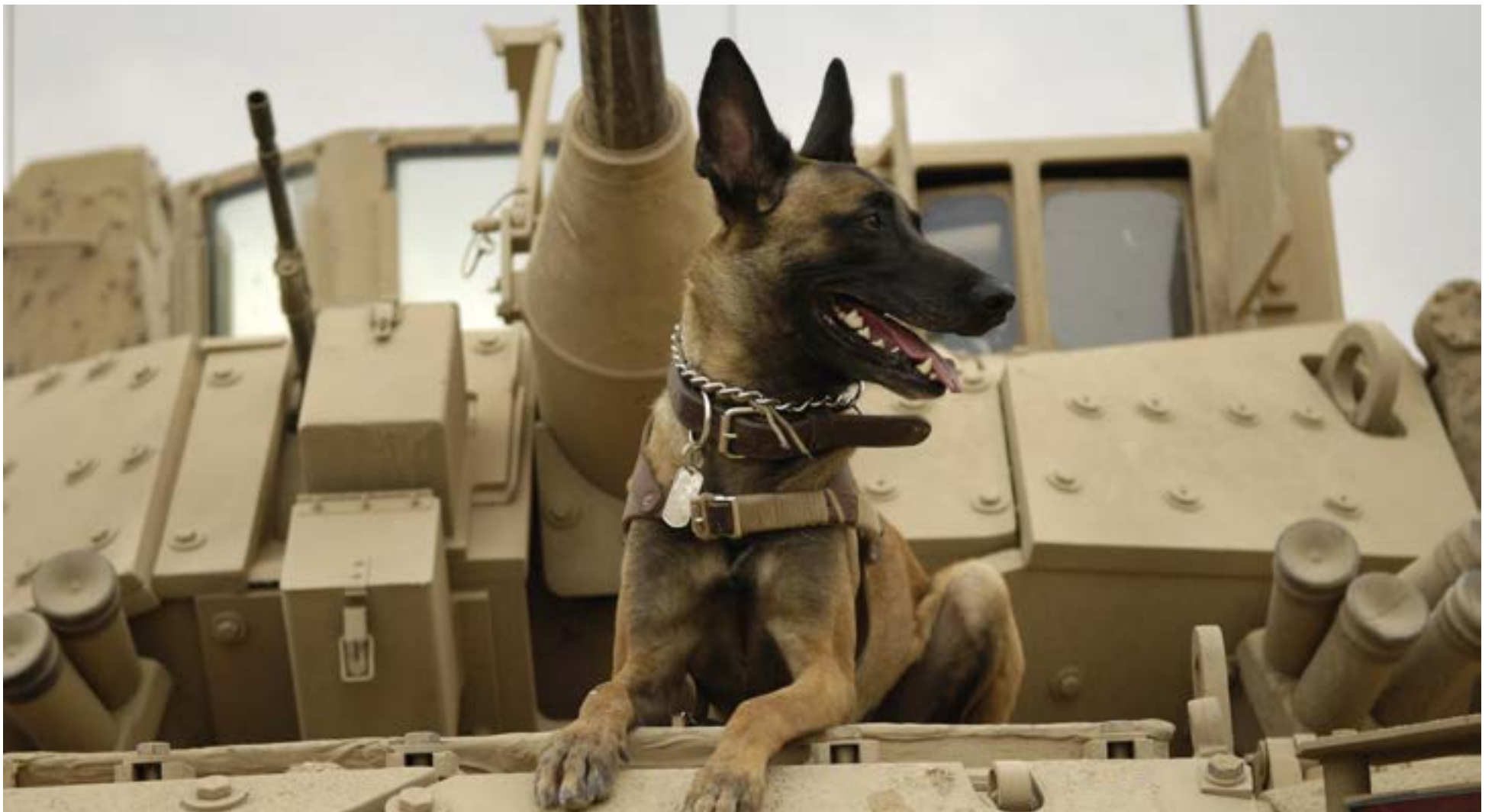
El perro de trabajo militar Jackson de la Fuerza Aérea de EE. UU. se sienta en un vehículo de combate M2A3 Bradley del Ejército de EE. UU. antes de salir a una misión.